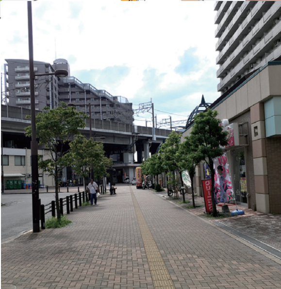
駅へのアプローチ(ロータリー側)