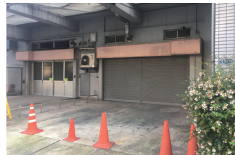
裏側:裏の通りからの景観