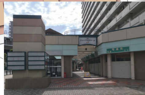
駅へのアプローチ(ショッピングモール側)